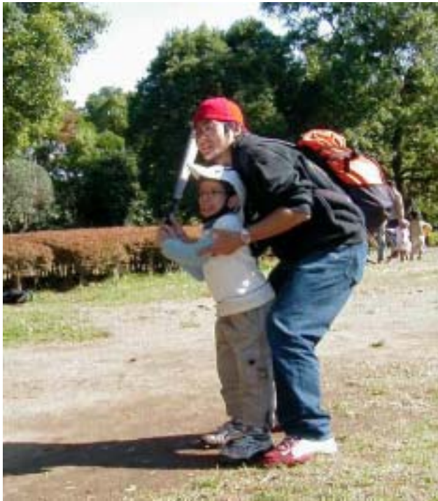
《リーダーと一緒に野球》

10月の「わんぱくクラブ」は19日(日)に習志野市の香澄公園に行きました。今回はデシリダーと大谷ディレクターのレポートです。