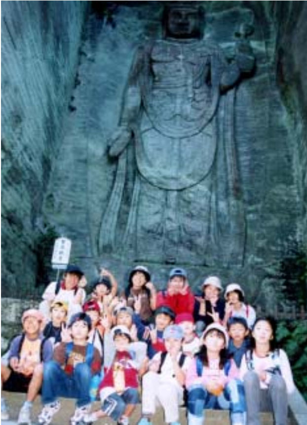
《岩に彫られた観音様の前で集合写真》