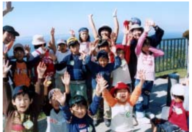
《鋸山頂上展望台で》

10月17日(日)に富津市の鋸山登山をしました。10月は、ぼんリーダーのレポートです。