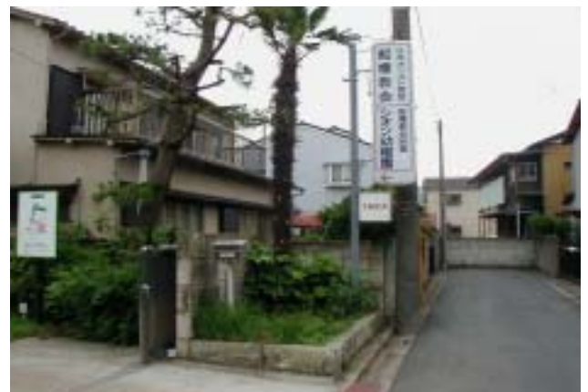
《船橋教会・シオン幼稚園の入口》

2. 実施場所・施設名：千葉YMCA船橋地域デポ(通称船橋YMCA)(日本基督教団船橋教会内教会学校教室、附属シオン幼稚園ホール)及び周辺施設(近隣の森林公園、公共ホールなど)船橋市夏見6-6-6(047-425-6366)及び周辺施設