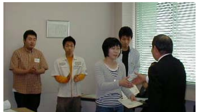
《委嘱状を受け取る当日出席のリーダー達》

今回の総会での問題のひとつは、総会構成員が昨年に比べ25名も減っていることです。本総会において会則が改正され、総会構成員の必要条件がYMCAへの所属期間が従来の1年以上から3ヶ月以上に緩められました。今後、協力会員の増強に努力していかなければなりません。