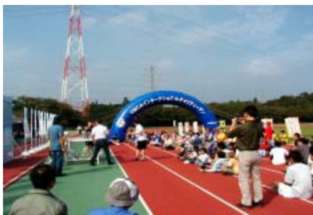
《去年のチャリティーランの抽選会》

2006年の第9回千葉YMCAチャリティーランは、2006年10月21日(土)に開催したい旨を船橋市に申し入れました。昨年は前後の土曜日は雨でしたが、開催日の2005年10月15日は天候に恵まれました。今年も、雨の場合でも実行可能なオプションプログラムを用意したいと思っています。