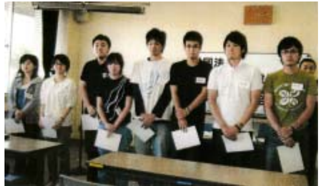
《委嘱状を受け取った当日出席のリーダー達》