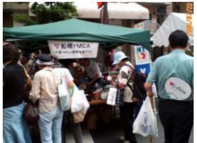
《この写真は去年のお店です》

船橋YMCAは今年もふなばし市民まつりのジョイ&ショッピングフェアフリーマーケットに、参加します。