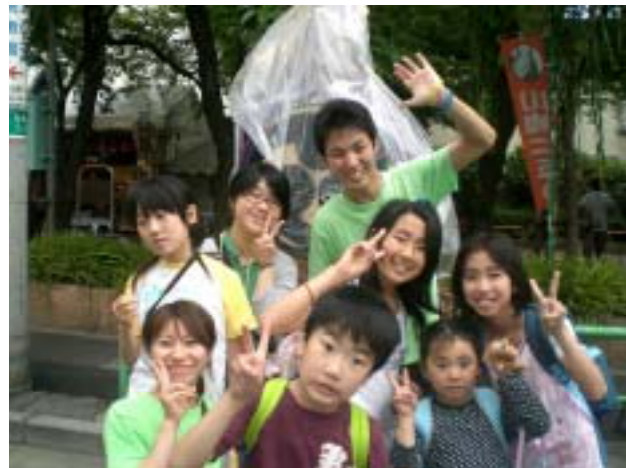
《お祭りの太鼓の前で》