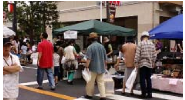
《今年のお店は海老川の橋の近くでした》