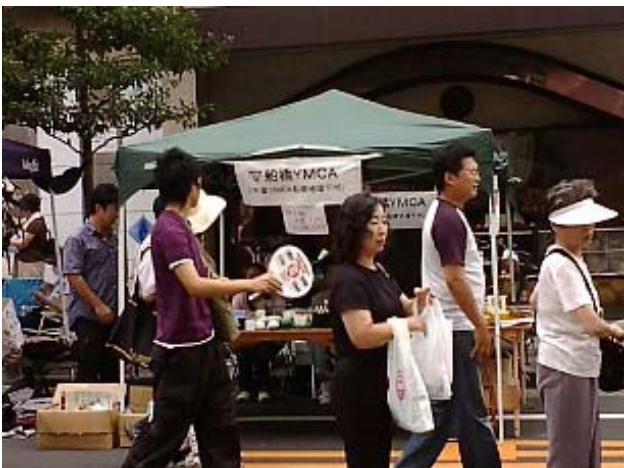
《今年のお店はダンスステージの近くでした》

今回は、YMCA学院高等学校の生徒6名が売り子として協力してくれました。売値が100円以下の商品を大きな声で売った結果、売上げは7,630円に達し、全額を国際協力募金に寄付しました。