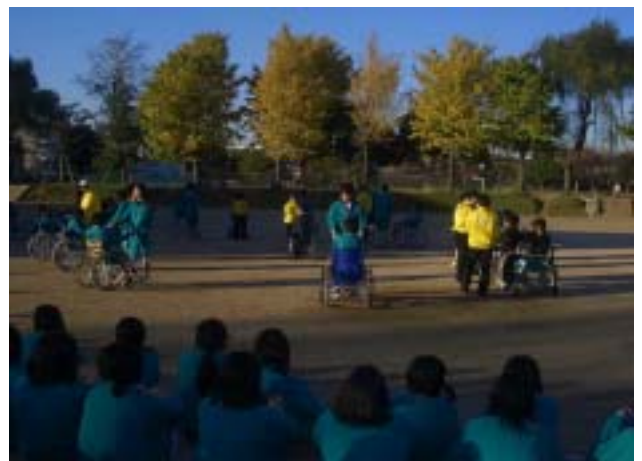
《最後に皆で車いすダンスをやりました》