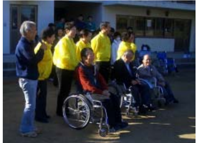
《毎回指導していただく皆様です》

参加したボランティアは、船橋市障害者友の会、車いすダンスグループ矢車草および社会福祉協議会の方々と、YMCA学院高等学校千葉センターの生徒10名・教師3名の皆さんでした。