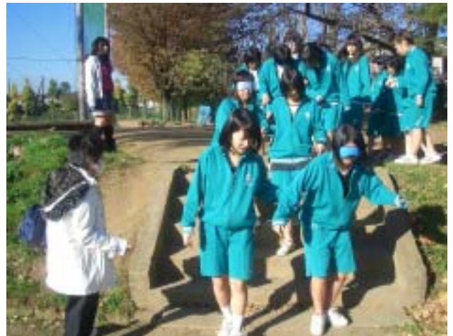
《目隠しをして友達の介助で階段を下ります》