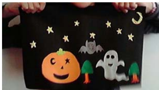
《素敵な作品ができました》