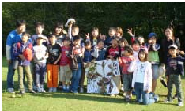
《参加者全員で記念撮影》