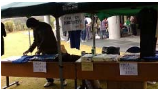
《船橋Y M C Aのお店です》

10月25日(日)に千葉県長生郡長柄町にある「千葉市少年自然の家」で開かれた“秋のわいわいフェスティバル”に、船橋Y M C Aのお店を出しました。今回もY M C A学院高等学校の生徒達が売り子として活躍してくれました。