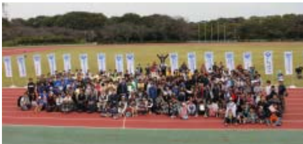
《閉会式の後で、全員の集合写真》

今年も船橋Y M C Aとして、Y M C Aコーナーに出店し、瀬戸物や文房具などの小物を販売しました。今年の売上は4,150円で、全額をY M C A国際協力募金に寄付しました。