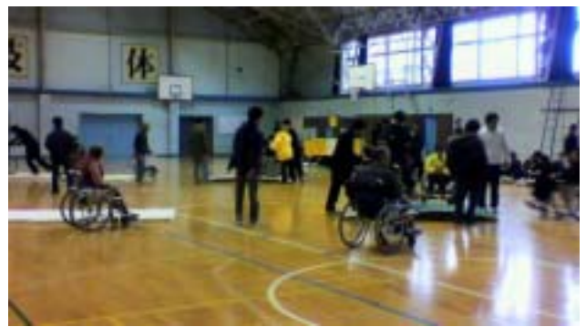
《体操マットや踏み切り板でコースを作ります》

スグループ矢車草7名および社会福祉協議会2名の方々と、YMCA学院高等学校千葉センターの生徒9名・教師3名の皆さんでした。