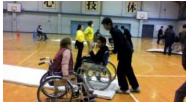
《体操マットの上を友達の介護で進みます》