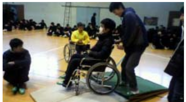
《下り坂は後ろ向きになって下ります》

車いす体験と共に、バンダナで目隠しをして友達の介助で階段の上り下りや障害物のあるところを歩く視覚障がい体験も行なわれました。