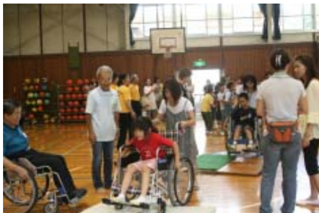
《車いすに乗って踏切り板とマットを越えます》

車いすに乗ったのが面白かったです。車いすを押してマットを歩いた時、マットがしずんで歩きにくかったです。目の不自由な人の体験をした時にも見えなくてころびそうになったけど、とても楽しかったです。