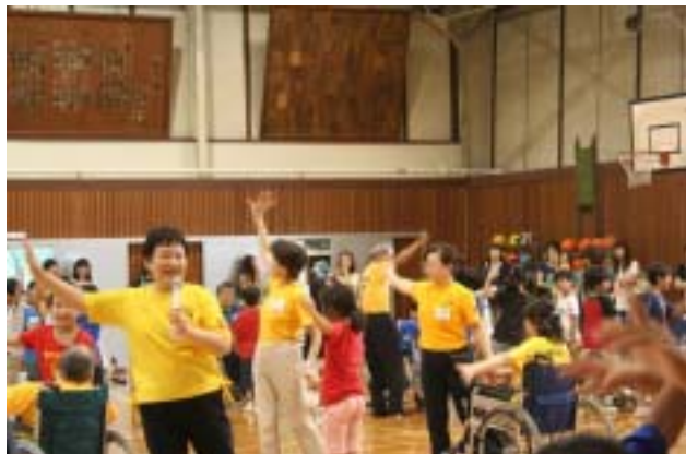
《車いすダンスの様子です》

がこわかったです。目が不自由な人は大変なんだなあと思いました。色々なことを教えてくれて、ありがとうございました。最後にやったダンスも楽しかったです。