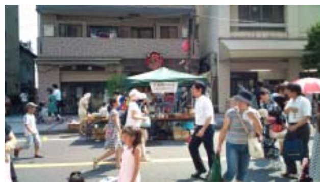
《お店はラーメン屋「でめきん」の前でした》

船橋Y M C Aは、7月24日(土)に行われたふなばし市民まつりの「ジョイ&ショッピングフェア」に参加しました。当日は、猛暑でうだるような暑さの中、水分補給に努めながら汗をかきかき商売に精を出しました。