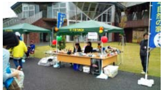
《船橋Y M C Aのお店です》

10月31日(日)に千葉県長生郡長柄町にある「千葉市少年自然の家」で開かれた“秋のわいわいフェスティバル”に、船橋Y M C Aのお店を出しました。今回もY M C A学院高等学校の生徒達が売り子として活躍してくれました。