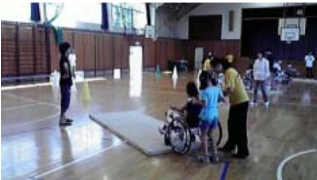
《体操マットに上がるのはちょっとの段差ですが大変です》

車いす体験は、学校の体育館に跳び箱の踏み切り板と体操マットとパイロンを並べたコースを3つ作って、二人一組で各々車いすに乗る体験と車いすを押し体験を交代でしました。