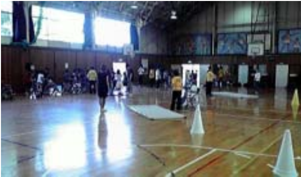
《車いす体験のコースの全体風景》

今回は4年生137名が対象で、視覚障がい体験と車いす体験を行いました。ご協力いただいたボランティアの方々は、船橋市障害者友の会4名、車椅子ダンス普及会矢車草8名、船橋市社会福祉協議会ボランティアセンター2名と千葉YMCA高等学院の生徒と教師15名でした。