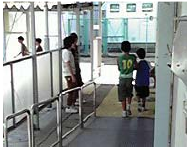
《視覚障がい体験は連絡通路で行いました》

視覚障がい体験【白杖(はくじょう)体験】は、二人一組で各々アイマスクをして歩く体験とアイマスクをしている人を介助する体験を交代でしました。