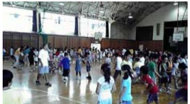
《みんなで車いすダンスをしました》

全員が車いす体験と視覚障がい体験をした後、車いすダンスの模範演技を見て、その後全員で車いすダンスを行いました。最後に、障がいを持つ方々から日常生活における困った事、不便な事、良かった事をお話いただき、この日の体験教室は終了となりました。