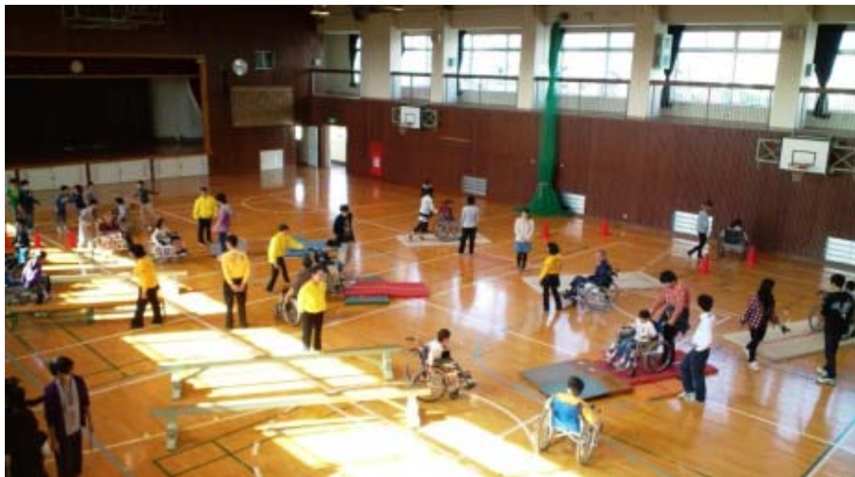
《法典西小の体育館の車いす体験コースの全景です》

の方々、車いすダンスグループ矢車草の方々および社会福祉協議会の方々と、Y M C A 学院高等学校千葉センターの生徒と教師の方々総勢20名をこえるボランティアの皆さんに支えられています。