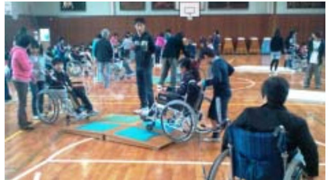
《法典西小の車いす体験の様子です》

12月3日は朝方、前線の通過に伴う大雨と強風に見舞われボランティアの方々には足の確保に苦労しました。法典西小学校の体育館は2階にあるのですがスロープもエレベーターもなく、車いすに乗った障がい者の方を車いすごと大人4人がかりで持ち上げ、階段を上り下りする苦労もありました。