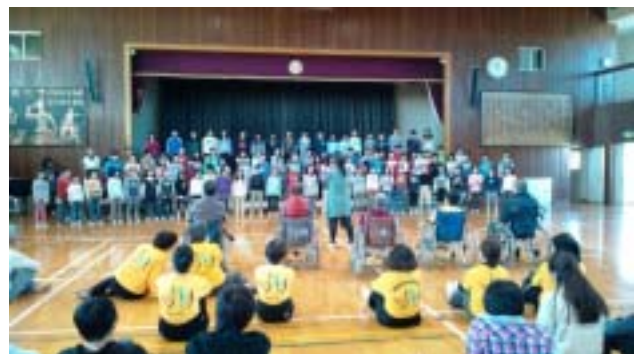
《法典西小の皆さんの感謝の合唱です。》

12月15日の夏見台小学校では4年生128名が3つのグループに分かれて、自分がやりたい体験を車いす体験、視覚障がい体験および高齢者擬似体験の中からひとつ選んで体験しました。