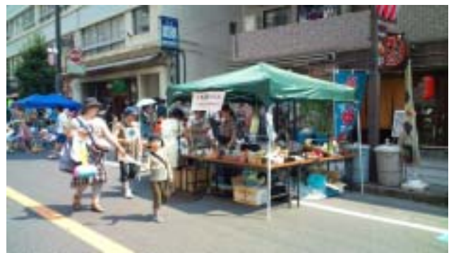
《これは去年のお店の様子です》

船橋Y M C Aは、ジョイ&ショッピングフェアフリーマーケットに参加しますので、みなさんお買い物にお出てください。今年もY M C A学院高等学校千葉センターの高校生が売り子として活躍してくれます。