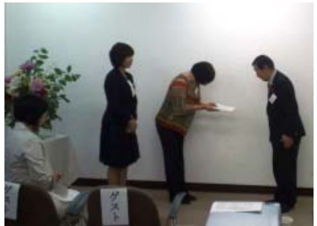
《目録を受け取るまえはら子育てネットワークの代表》

千葉YMCAのチャリティーランは、船橋市運動公園（船橋市夏見台）を無料で借用して実施されています。そこで地元への貢献として毎年チャリティーランの益金の一部を船橋市内の福祉団体や障がい者施設に寄付してきました。