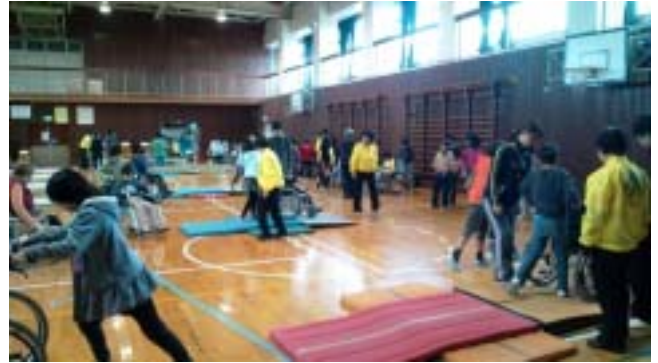
《法典西小の車いす体験の様子です》

12月2日の法典西小学校では4年生109名が車いす体験と視覚障がい体験をしました。ご協力いただいたボランティアの方々は、船橋市障害者友の会5名、車椅子レクダンス普及会矢車草8名と千葉YMCA高等学院の生徒と教師19名でした。