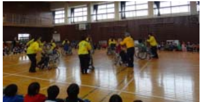
《法典西小の車いすダンスの様子です》

12月14日の夏見台小学校では4年生122名が3つのグループに分かれて、自分がやりたい体験を車いす体験、視覚障がい体験および高齢者擬似体験の中から順番に選んですべて体験しました。この日、ご協力いただいたボランティアの方々は、船橋市障害者友の会3名、車椅子レクダンス普及会矢車草7名と千葉YMCA高等学院の生徒と教師19名でした。