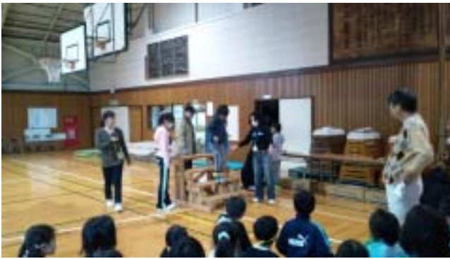
《夏見台小の高齢者擬似体験の様子です》

視覚障がい体験は、アイマスクをして介助者の手の袖を軽くつかんで、体育館のステージの階段を上り下りしました。