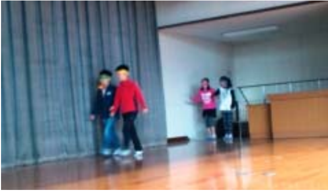
《夏見台小の視覚障がい体験の様子です》

視覚障がい体験は、アイマスクをして介助者の手の袖を軽くつかんで、体育館のステージの階段を上り下りしました。