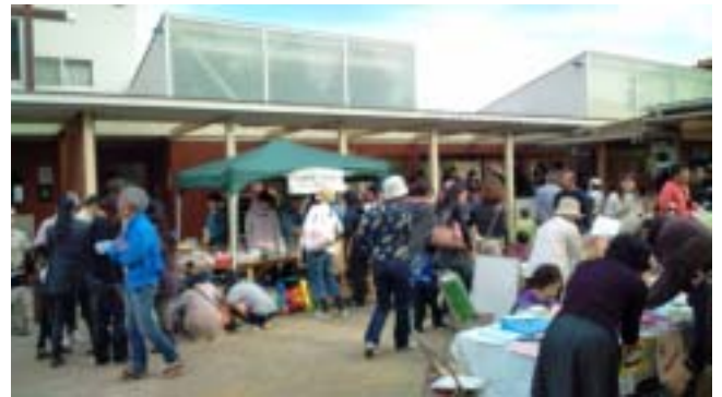
《いつものテントのお店です》

2011年11月3日(木)に開かれた日本基督教団船橋教会のバザーに参加しました。