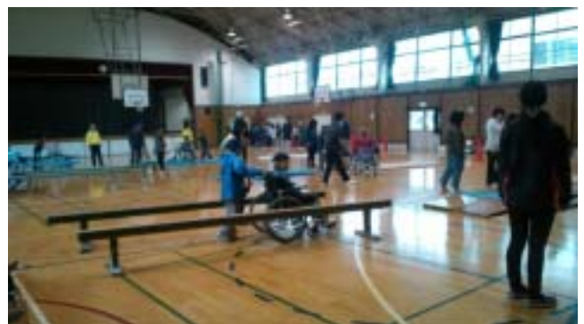
《夏見台小の車いす体験の様子です》

12月14日の夏見台小学校では4年生122名が3つのグループに分かれて、自分がやりたい体験を車いす体験、視覚障がい体験および高齢者擬似体験の中から順番に選んですべて体験しました。この日、ご協力いただいたボランティアの方々は、船橋市障害者友の会3名、車椅子レクダンス普及会矢車草7名と千葉YMCA高等学院の生徒と教師19名でした。