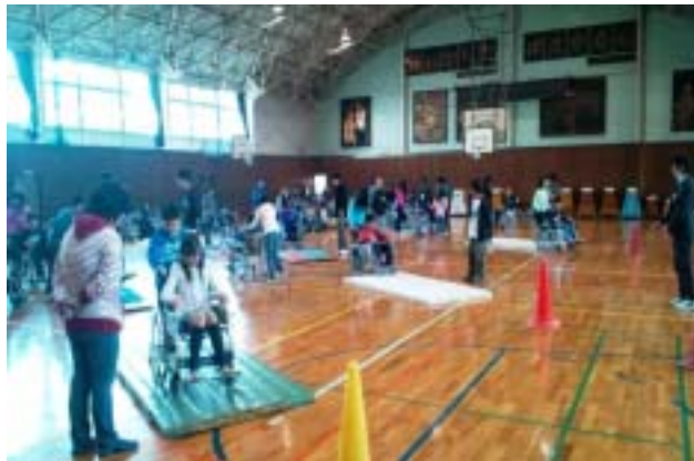
《体操用マットの上を押して歩くのは大変です》