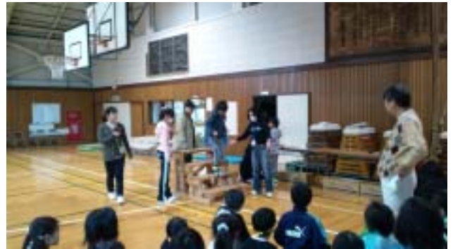
《高齢者体験は白内障を模した眼鏡をかけ、足に 錘をつけて杖をついて階段を上り下りします》