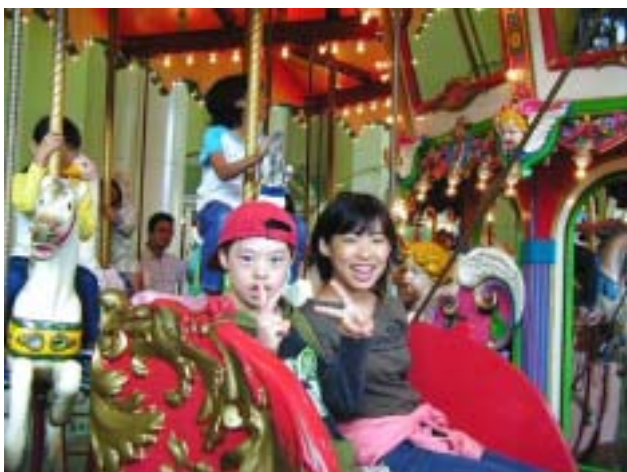
《TEPCO地球館のメリーゴーランド》

雨とのことでしたので、雨プロ（野外活動の用語で天候の悪い場合のプログラムのこと）として実施しました。当日は、雨は降りませんでした。