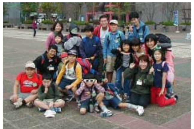
《ポートアリーナの前で集合写真》

10月の「わんぱくクラブ」は20日(日)に千葉市のポートアリーナにあるTEPCO地球館に15名の参加者と行きました。当日は、天気予報では小