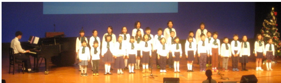
市民クリスマス in 千葉 2019 の讚美歌合唱(千葉市民会館大ホールで) 今年は残念ながら休止となりました。