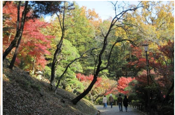
(右)健康ウォーキング(11/25)で訪れた成田山公園の紅葉

千葉 YMCA ニュースボード 2024年1月1日 第292号 https://www.chibaymca.net/