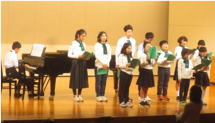
(左)市民クリスマス in 千葉 2023 でキャロルを歌う児童たち